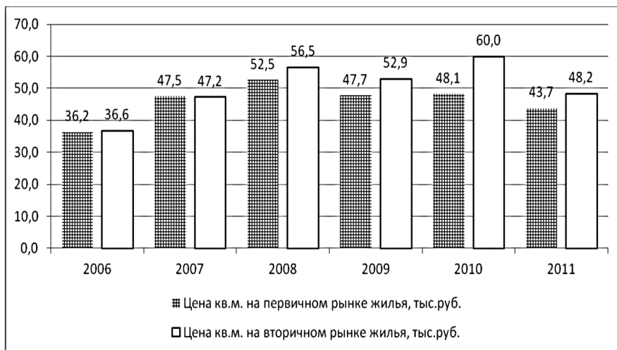
Рис. Динамика цен на жилую недвижимость на первичном и на вторичном рынках в период 2006-2011 гг.

оценкам уменьшение стоимости жилья на 20% сделает ипотеку доступной для более, чем 1 млн. семей, которые сейчас не могут себе ее позволить 1 . Важным фактором, влияющим на уровень доступности жилья гражданам, является изменение цен на жилье как на первичном, так и на вторичном рынках (см. рис.).